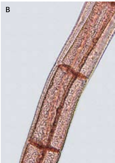
149. Fin Ledtang ( Polysiphonia stricta ) A: Skudspids med hårs kud (trichoblaster), og 4 pericentralceller ses tydeligt. B: Seg- menter med 4 pericentralceller uden bark. Ø 70 µm.